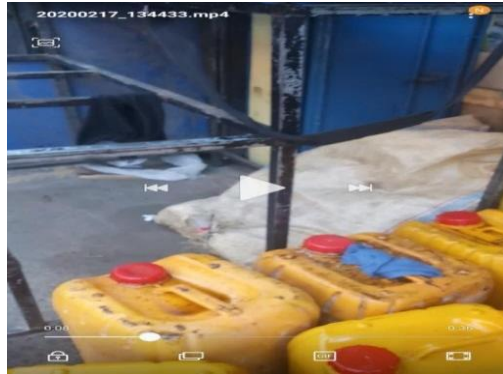
පාරිභෝගික කටයුතු පිළිබඳ අධිකාරිය විසින් සිදු කරන ලද වැටලීම්

05. භාවිතා කරනු ලැබූ ෆාම් තෙල් ලීටර් 200 ක් කොළඹ 11 ප්‍රදේශයේ දී විකිණීමට ඉදිරිපත් කර තිබියදී 17.02.2020 වන දින පාරිභෝගික කටයුතු පිළිබඳ අධිකාරියේ ප්‍රධාන කාර්යාලය මඟින් වැටලීමක් සිදු කරන ලදී.